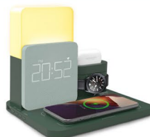
스마트기기 무선충전기 (3명)