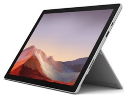
Microsoft Surface Go 2 (1명)

사전등록 후 세미나에 참여해주신 분들께 추첨을 통해 다양한 선물을 드립니다.