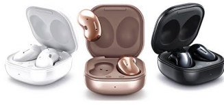
Galaxy Buds Live (2명)