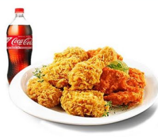
BHC 치킨 세트 (10명)