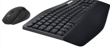
Logitech 키보드/마우스 (2명)